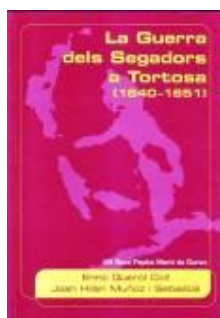
Segadors a Tortosa